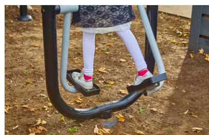
Aangepaste toestellen voor de kleinsten

“ Dankzij de toestellen van OFS zijn onze leerlingen véél actiever tijdens de pauzes. Ze organiseren een parcours en houden records bij.”