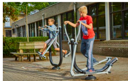
Moonwalker & Crosstrainer