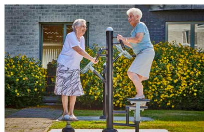
Waistline and Step